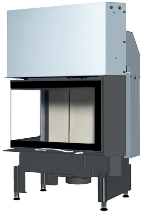
63x40x42S 2.0 links - Art. no. 360153